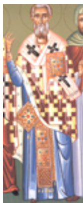
Άγιος Λέων Πάπας Ρώμης