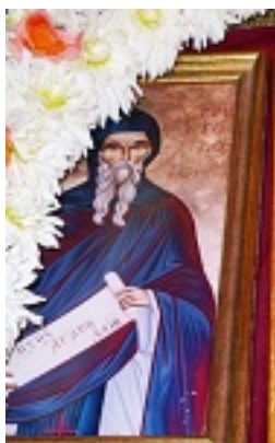
Όσιος Γρηγόριος Μυστριώτης ο εν Στρογγυλή των Λιχάδων