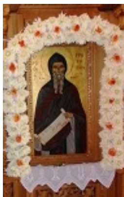
Όσιος Γρηγόριος Μυστριώτης ο εν Στρογγυλή των Λιχάδων