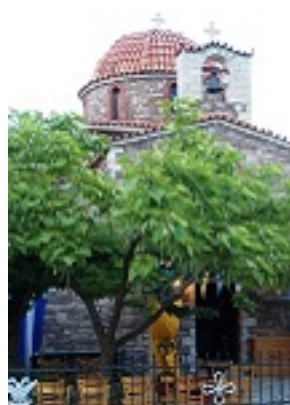
Ο Ιερός Ναός του Οσίου Γρηγορίου Μυστριώτη