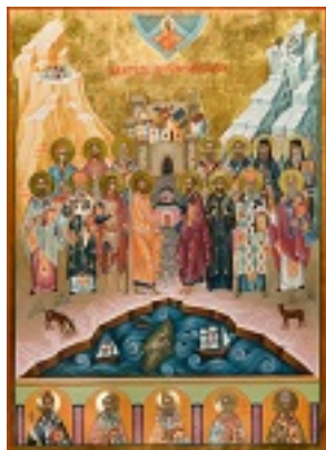
Σύναξη πάντων των εν Ρόδω Αγίων