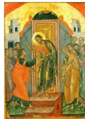
Η ψηλάφισις του Θωμά - 1546 μ.Χ. - Μονή Σταυρονικήτα, Άγιον Όρος (Κρητική σχολή, Θεοφάνης ο Κρής)