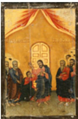
Η ψηλάφισις του Θωμά - Ι.Ν. Ζωοδόχου Πηγής, Λαρίσης ( www.panagialarisis.gr )