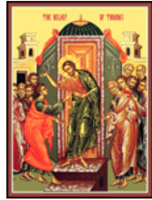
Η ψηλάφισις του Θωμά