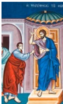
Η ψηλάφισις του Θωμά