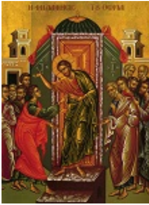
Η ψηλάφισις του Θωμά