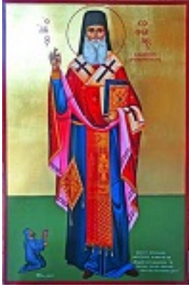
Άγιος Σοφιανός επίσκοπος