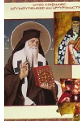
Άγιος Σοφιανός επίσκοπος

Δρυϊνουπόλεως καί Αργυροκάστρου Δρυϊνουπόλεως καί Αργυροκάστρου Δρυϊνουπόλεως καί Αργυροκάστρου