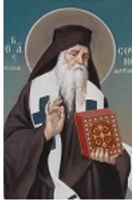
Άγιος Σοφιανός επίσκοπος