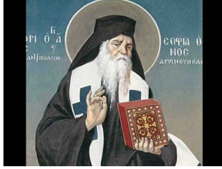
ΟΣΙΟΣ ΣΟΦΙΑΝΟΣ Ο ΣΗΜΕΙΟΦΟΡΟΣ (+26-11-1711)