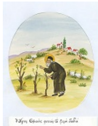
Άγιος Σοφιανός επίσκοπος

Δρυϊνουπόλεως καί Αργυροκάστρου Δρυϊνουπόλεως καί Αργυροκάστρου