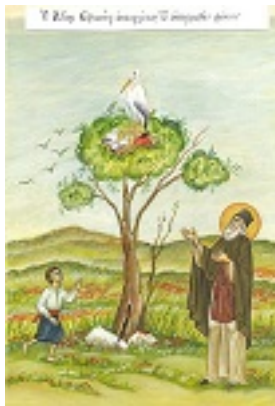
Άγιος Σοφιανός επίσκοπος

Δρυϊνουπόλεως καί Αργυροκάστρου Δρυϊνουπόλεως καί Αργυροκάστρου Δρυϊνουπόλεως καί Αργυροκάστρου