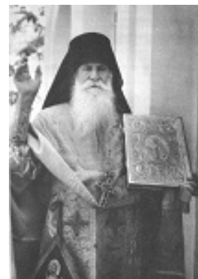
Όσιος Άνθιμος ο Βαγιάνος ο εν Χίω