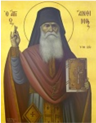
Όσιος Άνθιμος ο Βαγιάνος ο εν Χίω