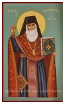
Όσιος Άνθιμος ο Βαγιάνος ο εν Χίω - Λυδία Γουριώτη© (lydiagourioti- iconography.blogspot.com)