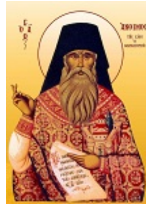
Όσιος Άνθιμος ο Βαγιάνος ο εν Χίω