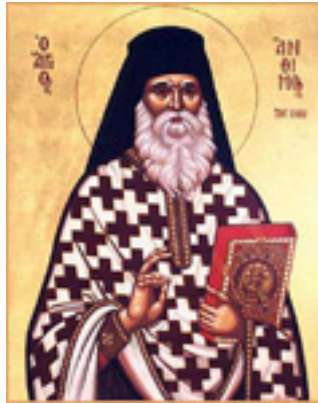
Όσιος Άνθιμος ο Βαγιάνος ο εν Χίω