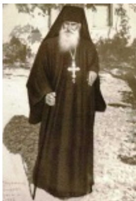
Όσιος Άνθιμος ο Βαγιάνος ο εν Χίω - 1957