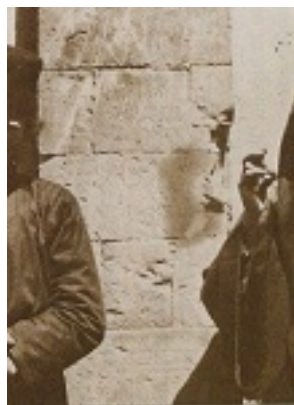
Ο Όσιος Νικηφόρος ο Λεπρός μαζί με τον Όσιο Άνθιμο τον Βαγιάνο