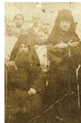
Ο Όσιος Νικηφόρος με τον Όσιο Άνθιμο και τροφίμους του Λωβοκομείου Χίου