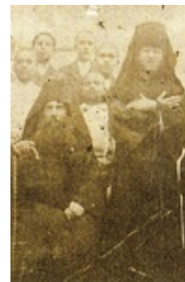
Ο Όσιος Νικηφόρος με τον Όσιο Άνθιμο και τροφίμους του Λωβοκομείου Χίου