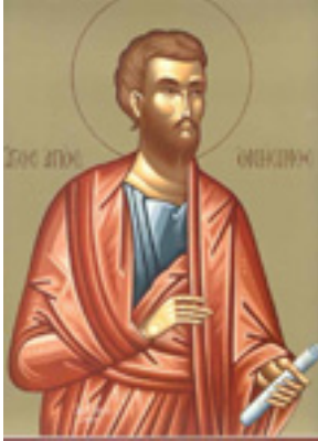
Άγιος Ονήσιμος<br />ο Απόστολος