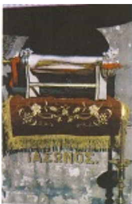
Η λειψανοθήκη του Αγίου Ιάσονος στον ομώνυμο Ιερό Ναό της Κερκύρας