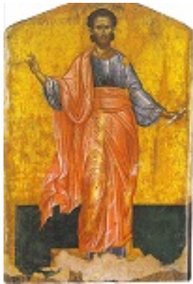
Άγιος Ιάσων ο Απόστολος - Φορητή εικόνα του 1649 μ.Χ. του Εμμανουήλ Τζάνε στον Ιερό Ναό Αγίων Ιάσονος και Σωσιπάτρου Κερκύρας