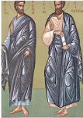
Άγιοι Ιάσωνας και Σωσίπατρος οι Απόστολοι