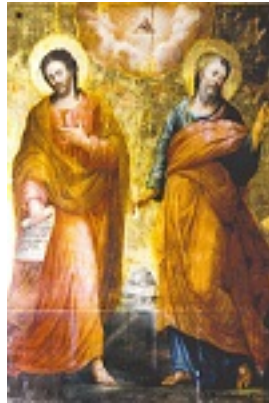
Άγιοι Ιάσωνας και Σωσίπατρος οι Απόστολοι - Φορητή εικόνα του Σπυρίδωνος Σπεράντζα