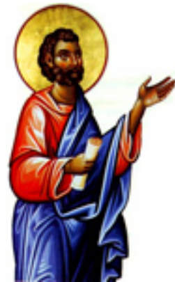
Άγιος Σωσίπατρος ο Απόστολος