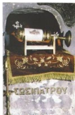
Η λειψανοθήκη του Αγίου Σωσιπάτρου στον ομώνυμο Ιερό Ναό της Κερκύρας