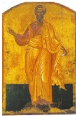
Άγιος Σωσίπατρος ο Απόστολος - Φορητή εικόνα του 1649 μ.Χ. του Εμμανουήλ Τζάνε στον Ιερό Ναό Αγίων Ιάσονος και Σωσιπάτρου Κερκύρας