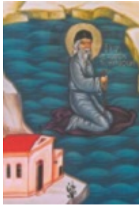
Ὁσιος Αὐξέντιος ὁ ἐν Καρτελίᾳ ασκήσας