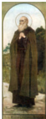
Όσιος Ισαάκιος Εγκλειστος ο εκ Ρωσίας