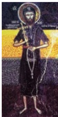
Άγιος Δαμιανός ο μοναχός