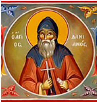
Άγιος Δαμιανός ο μοναχός