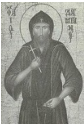
Άγιος Δαμιανός ο μοναχός