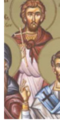
Άγιος Νικόλαος ο Νεομάρτυρας ο εξ Ιχθύος της Κορινθίας