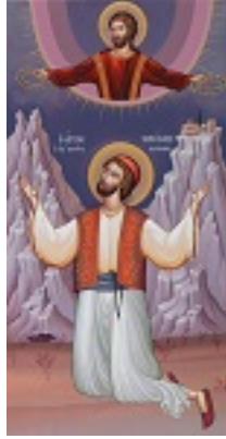
Άγιος Νικόλαος ο Νεομάρτυρας ο εξ Ιχθύος της Κορινθίας