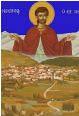
Άγιος Νικόλαος ο Νεομάρτυρας ο εξ Ιχθύος της Κορινθίας