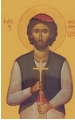
Άγιος Νικόλαος ο Νεομάρτυρας ο εξ Ιχθύος της Κορινθίας