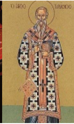
Άγιος Ταράσιος Αρχιεπίσκοπος Κωνσταντινούπολης