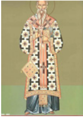
Άγιος Ταράσιος Αρχιεπίσκοπος Κωνσταντινούπολης