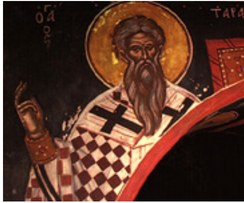
Άγιος Ταράσιος Αρχιεπίσκοπος Κωνσταντινούπολης