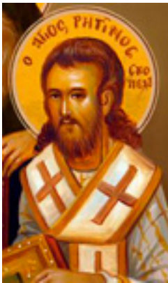
Άγιος Ρηγίνος ο Ιερομάρτυρας επίσκοπος Σκοπέλου