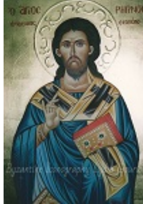
Άγιος Ρηγίνος ο Ιερομάρτυρας επίσκοπος Σκοπέλου - Λυδία Γουριώτη© ( http://lydiagourioti- iconography.blogspot.com )