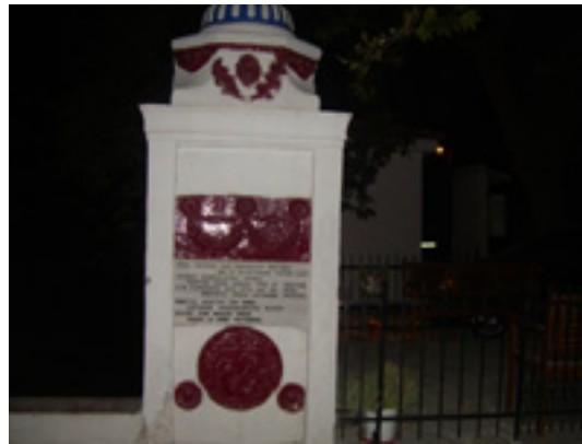
Το σημείο αποκεφαλισμού του Αγίου Ρηγίνου