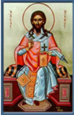
Άγιος Ρηγίνος ο Ιερομάρτυρας επίσκοπος Σκοπέλου