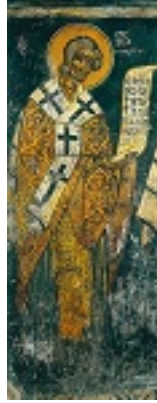
Άγιος Ιωάννης ο Καλοκτένης Μητροπολίτης Θηβών