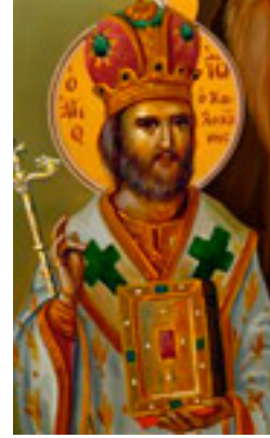
Άγιος Ιωάννης ο Καλοκτένης Μητροπολίτης Θηβών