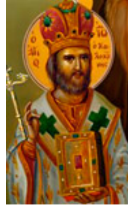
Άγιος Ιωάννης ο Καλοκτένης Μητροπολίτης Θηβών