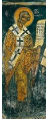
Άγιος Ιωάννης ο Καλοκτένης Μητροπολίτης Θηβών