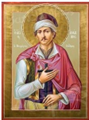
Άγιος Ιωάννης ο Κάλφας ο Νεομάρτυρας