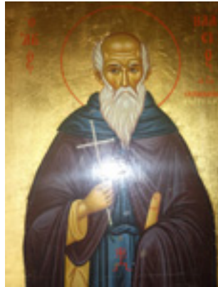
Ο Άγιος Βλάσιος όπως εμφανίστηκε στον άγιο γέροντα Παίσιο τον Αγιορείτη