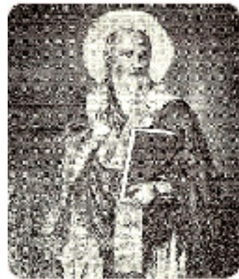
Άγιος Βλάσιος ο ιερομάρτυρας εξ Ακαρνανίας