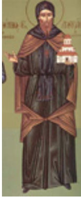
Όσιος Λουκάς ὁ ἐν Στειρίῳ ὄρει ἄσκησας