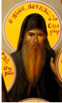
Όσιος Λουκάς ὁ ἐν Στειρίῳ ὄρει ἄσκησας