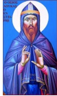
Όσιος Λουκάς ὁ ἐν Στειρίῳ ὄρει ἄσκησας