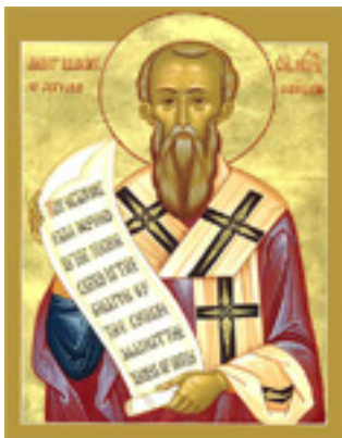
Άγιος Λέανδρος<br />Επίσκοπος Σεβίλλης