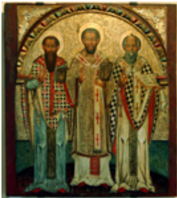
Άγιοι Τρεις Ιεράρχες