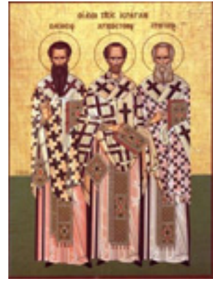
Άγιοι Τρεις Ιεράρχες