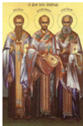
Άγιοι Τρεις Ιεράρχες