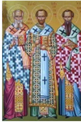
Άγιοι Τρεις Ιεράρχες (Ι.Μ. Οσίου Γρηγορίου - Άγιον Όρος)