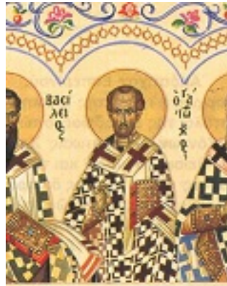
Άγιοι Τρεις Ιεράρχες