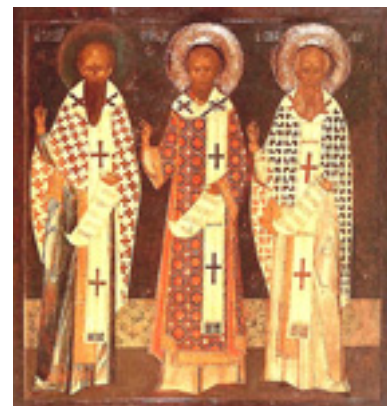
Άγιοι Τρεις Ιεράρχες