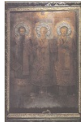
Άγιοι Τρεις Ιεράρχες (Ο Βασίλειος αριστερά, ο Χρυσόστομος δεξιά, στο κέντρο ο Γρηγόριος)- Φανάρι, Κωνσταντινούπολη