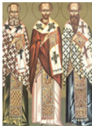
Άγιοι Τρεις Ιεράρχες