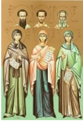
Αγίες Εμμελεία, Νόννα και Ανθούσα, οι μητέρες των Τριών Ιεραρχών