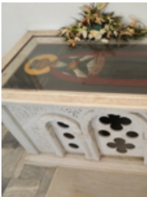
Ο τάφος του Αγίου Θεοδώρου του Χατζή, στο εξωκλήσι Αγ. Ιωάννου του Προδρόμου στον «Μόθωνα» της Μυτιλήνης