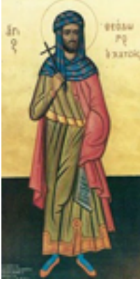
Άγιος Θεόδωρος ο Χατζής ο Μυτιληναίος