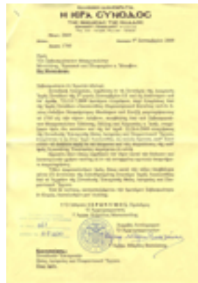
Συνοδική απόφαση εγκρίσεως Ακολουθίας Παρακλητικού Κανόνος του Αγίου Θεοδώρου του Χατζή