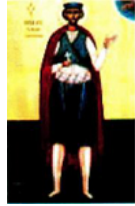
Άγιος Θεόδωρος ο Χατζής ο Μυτιληναίος