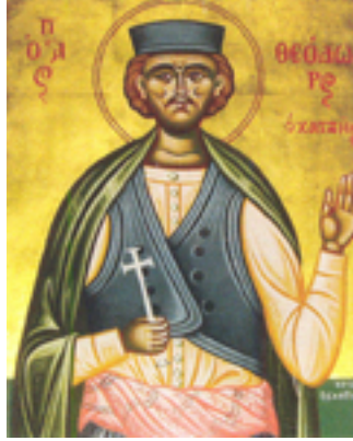
Άγιος Θεόδωρος ο Χατζής ο Μυτιληναίος