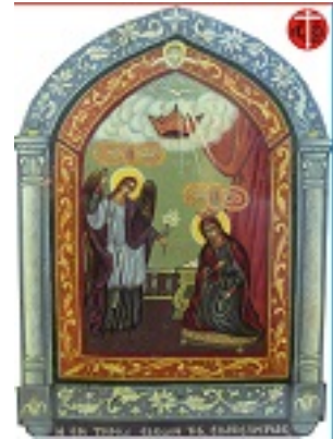
Παναγία η Μεγαλόχαρη της Τήνου