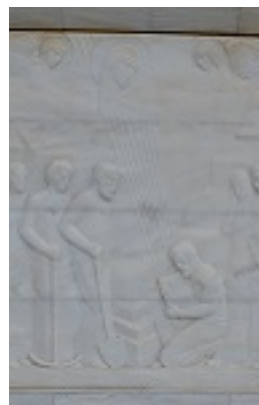
Το έργο αυτό απεικονίζει την εύρεση της Θαυματουργού εικόνας της Παναγίας από Φαλατιανούς, Ιερός Ναός Αγίας Τριάδος - Αγίου Ιωάννη, Φαλατάδος - Τήνος