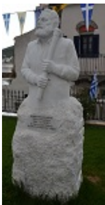
Δημήτρης Αντ. Βλάσης - Ο την αγίαν Εικόνα θεόθεν κινούμενος ευρών, Ιερός Ναός Αγίας Τριάδος - Αγίου Ιωάννη, Φαλατάδος - Τήνος