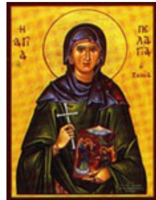
Οσία Πελαγία η Τηνια