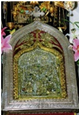
Παναγία η Μεγαλόχαρη της Τήνου