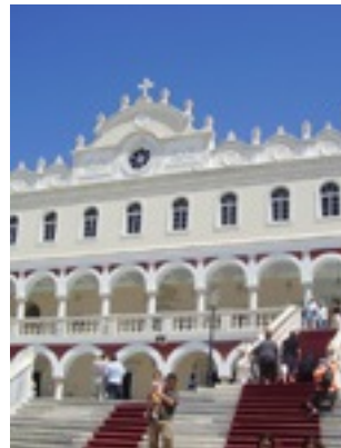
Παναγία η Μεγαλόχαρη της Τήνου