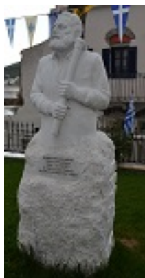
Δημήτρης Αντ. Βλάσης - Ο την αγίαν Εικόνα θεόθεν κινούμενος ευρών, Ιερός Ναός Αγίας Τριάδος - Αγίου Ιωάννη, Φαλατάδος - Τήνος