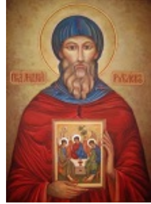
Άγιος Αντρέας Ρουμπλιόβ ο Εικονογράφος