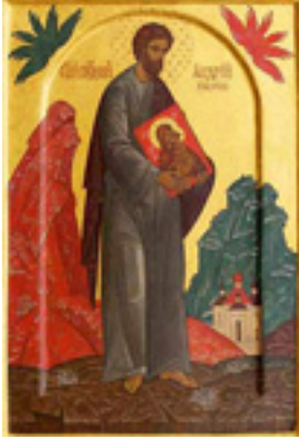
Άγιος Αντρέας Ρουμπλιόβ ο Εικονογράφος