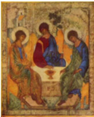
Άγιος Αντρέας Ρουμπλιόβ ο Εικονογράφος - Η φιλοξενία του Αβραάμ