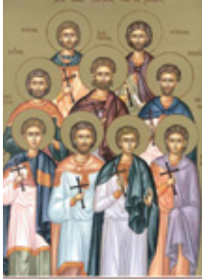
Άγιοι Εννέα Μάρτυρες εν Κυζίκω