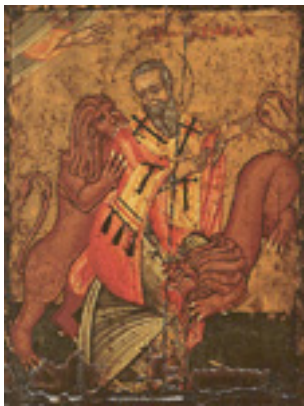
Άγιος Ιγνάτιος ο Θεοφόρος και Ιερομάρτυρας