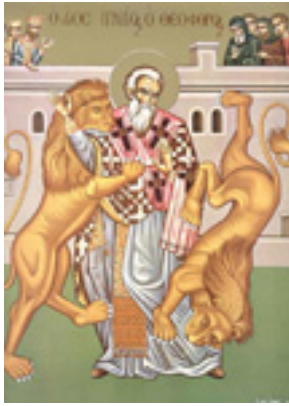
Άγιος Ιγνάτιος ο Θεοφόρος και Ιερομάρτυρας