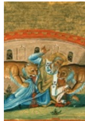
Άγιος Ιγνάτιος ο Θεοφόρος και Ιερομάρτυρας