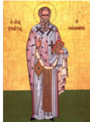
Άγιος Ιγνάτιος ο Θεοφόρος και Ιερομάρτυρας