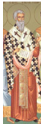
Άγιος Ιγνάτιος ο Θεοφόρος και Ιερομάρτυρας