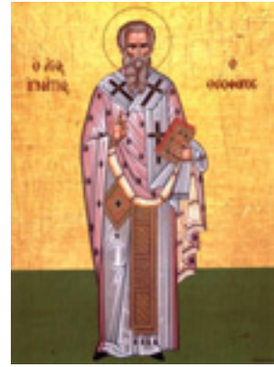
Άγιος Ιγνάτιος ο Θεοφόρος και Ιερομάρτυρας