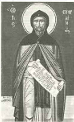
Όσιος Εφραίμ ο Σύρος - Φώτης Κόντογλου