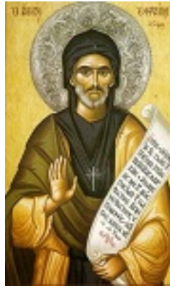
Όσιος Εφραίμ ο Σύρος