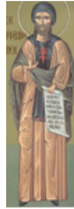
Όσιος Εφραίμ ο Σύρος