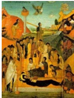
Κοίμηση του οσίου Εφραίμ του Σύρου - μέσα 15ου αι. μ.Χ. - Μονή Ιβήρων, Άγιον Όρος