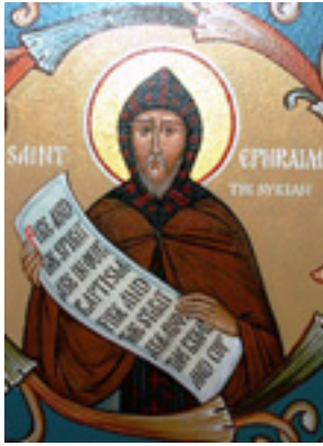
Όσιος Εφραίμ ο Σύρος