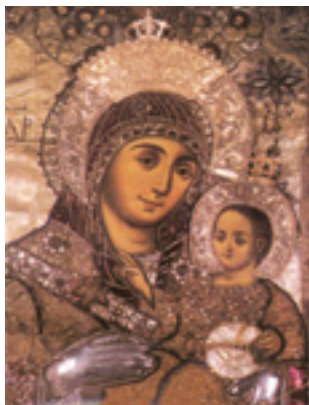
Παναγία η Βηθλεεμίτισσα