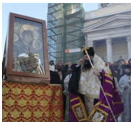
Υποδοχή της Παναγίας της<br />Βηθλεεμίτισσας στον<br />Πειραιά τον Νοέμβριο του<br />2009 μ.Χ.