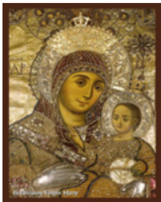
Παναγία η Βηθλεεμίτισσα