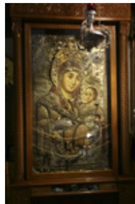
Παναγία η Βηθλεεμίτισσα