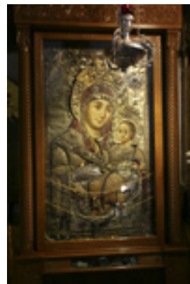
Παναγία η Βηθλεεμίτισσα