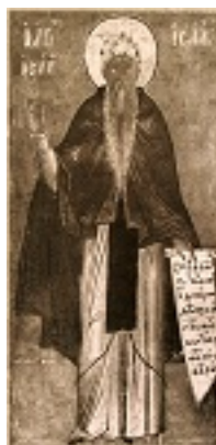
Όσιος Ισαάκ ο Σύρος