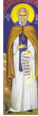
Όσιος Ισαάκ ο Σύρος