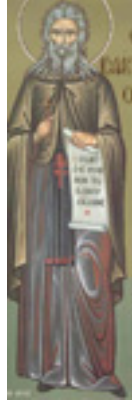
Όσιος Ισαάκ ο Σύρος