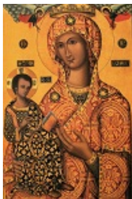
Σύναξη της Παναγίας της Τροοδίτισσας στην Κύπρο