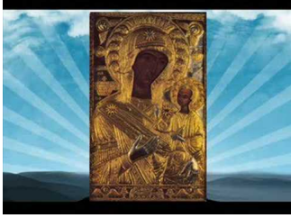
Παναγία Προυσιώτισσα - Απολυτίκιον & Μεγαλυνάρια