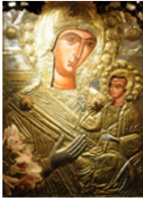
Παναγιά η Προυσιώτισσα