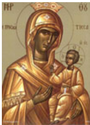
Παναγιά η Προυσιώτισσα