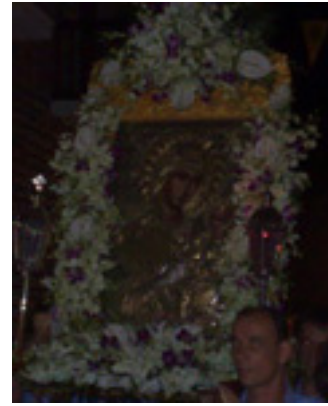
Παναγιά η Προυσιώτισσα