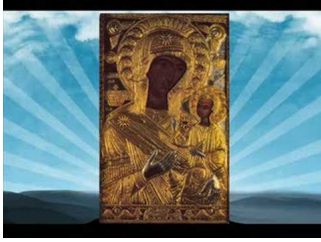
Παναγία Προυσιώτισσα - Απολυτίκιον & Μεγαλυνάρια