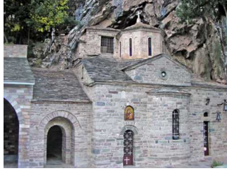
Παναγία Προυσιώτισσα η Αρχόντισσα της Ρούμελης