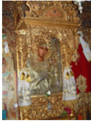
Παναγιά η Προυσιώτισσα