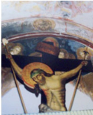
Παναγιά η Σκιαδενή στην Ρόδο