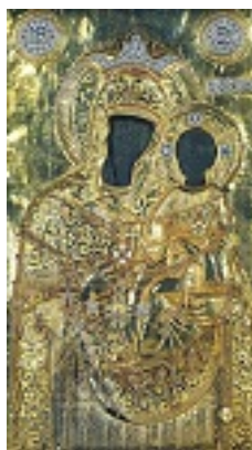
Σύναξη της Παναγιάς της Εικοσιφοίνισσας