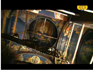
Ιερά μονοπάτια - ΕΤ3 Ι.Μ.Παναγίας Εικοσιφοίνισσας