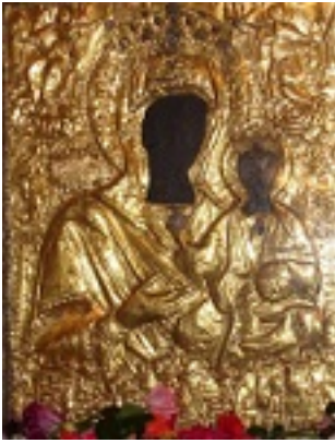
Παναγία η Μυρτιδιώτισσα