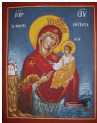
Παναγία η Μυρτιδιώτισσα - Στο κάτω μέρος της εικόνας εικονίζεται η ιστορία της Ιεράς Μονής Μερσινιδίου - Αγγελική Τσέλιου© (diaxeirosaggelikistseliou. blogspot.com)