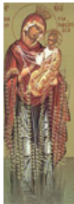
Παναγία η Μυρτιδιώτισσα