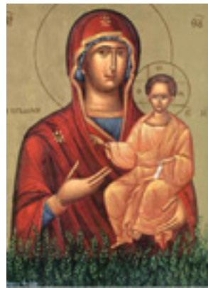
Παναγία η Μυρτιδιώτισσα