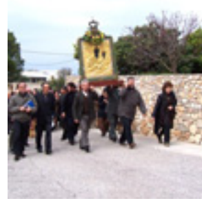
Παναγία η Μυρτιδιώτισσα στα Κύθηρα