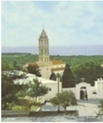
Παναγιά η Μυρτιδιώτισσα στα Κύθηρα