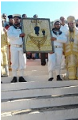
Παναγία η Μυρτιδιώτισσα στα Κύθηρα