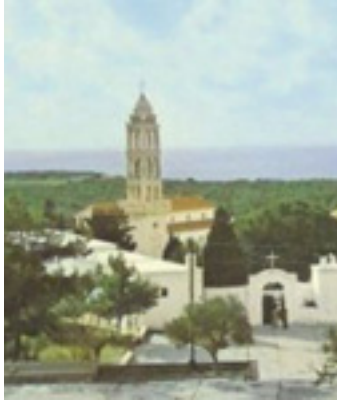
Παναγιά η Μυρτιδιώτισσα στα Κύθηρα