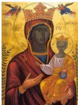
Παναγία η Μυρτιδιώτισσα