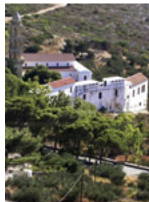
Παναγία η Μυρτιδιώτισσα στα Κύθηρα