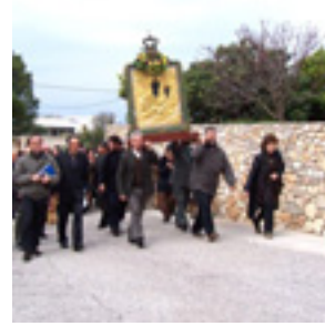
Παναγία η Μυρτιδιώτισσα στα Κύθηρα