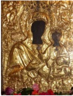
Παναγία η Μυρτιδιώτισσα