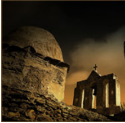
Παναγία η Δροσιανή