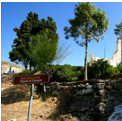
Παναγία η Δροσιανή