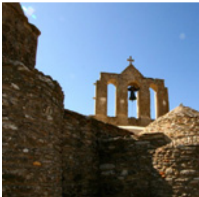
Παναγία η Δροσιανή