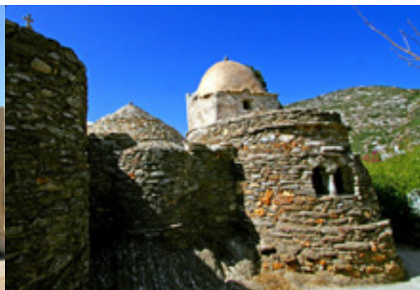
Παναγία η Δροσιανή