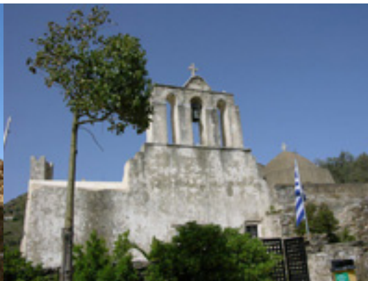
Παναγία η Δροσιανή