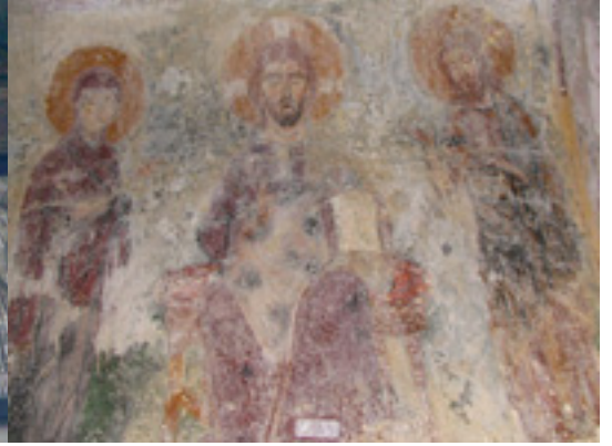
Παναγία η Δροσιανή