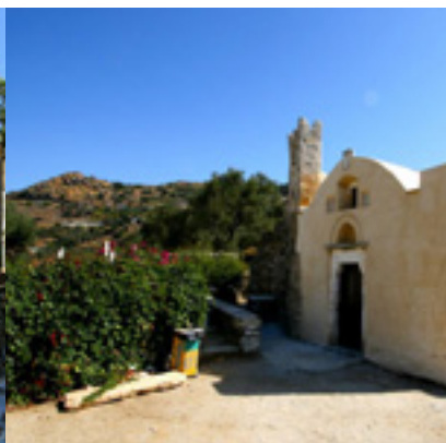
Παναγία η Δροσιανή