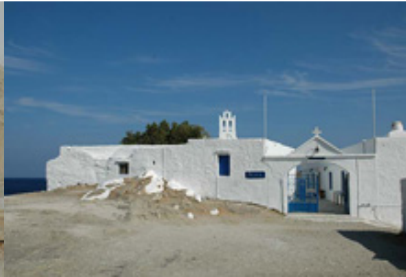
Παναγία η Χρυσοπηγή