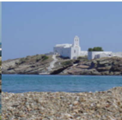
Παναγία η Χρυσοπηγή