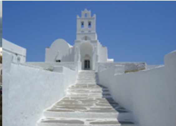
Παναγία η Χρυσοπηγή