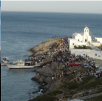
Παναγία η Χρυσοπηγή