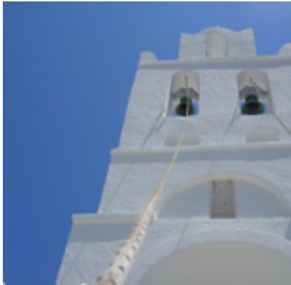
Παναγία η Χρυσοπηγή