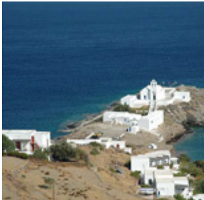
Παναγία η Χρυσοπηγή