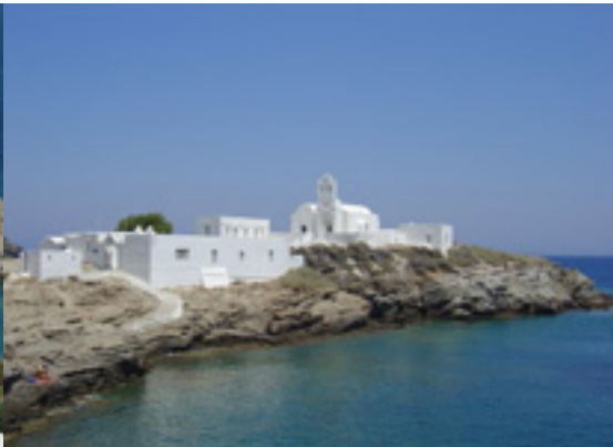
Παναγία η Χρυσοπηγή