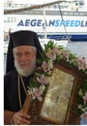
Ο Μητροπολίτης Σύρου Δωρόθεος Β' με την εικόνα της Παναγίας της Χρυσοπηγής