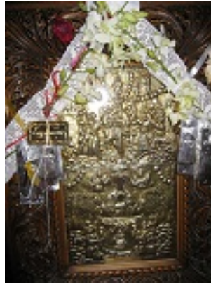
Παναγία η Χρυσοπηγή