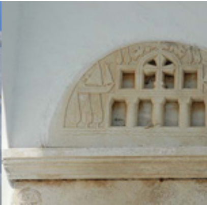
Παναγία η Χρυσοπηγή