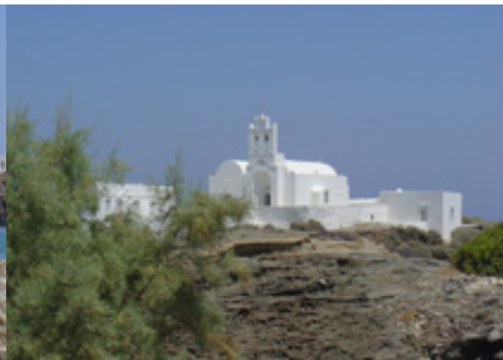
Παναγία η Χρυσοπηγή