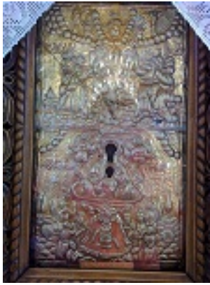
Παναγία η Χρυσοπηγή