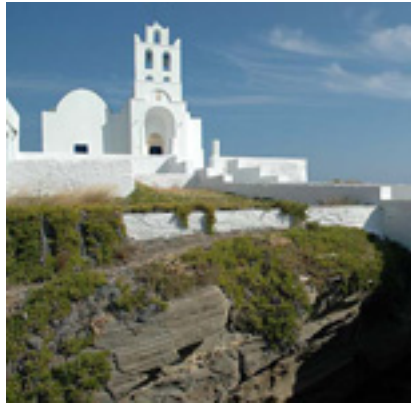
Παναγία η Χρυσοπηγή