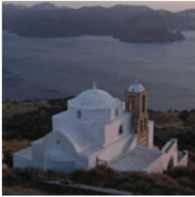
Παναγία η Θαλασσίτρα