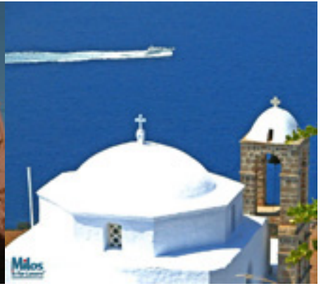
Παναγία η Θαλασσίτρα