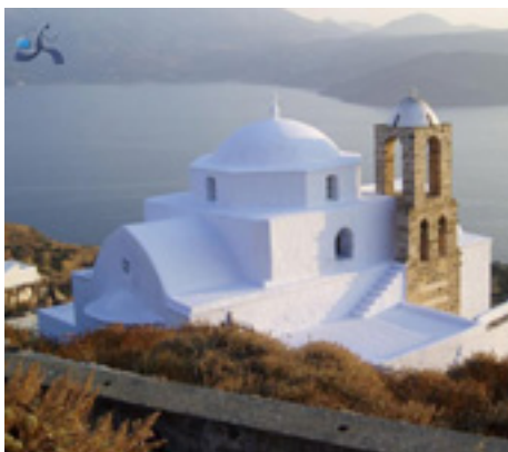
Παναγία η Θαλασσίτρα