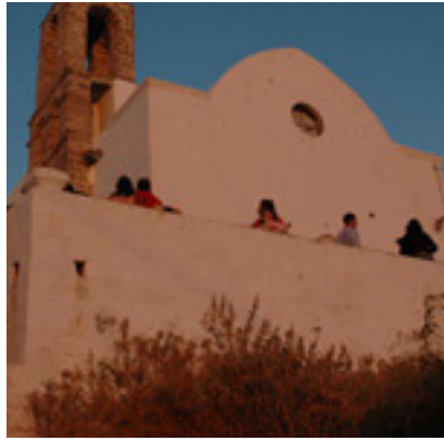
Παναγία η Θαλασσίτρα