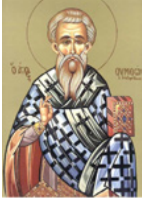
Άγιος Συμεών ο Αδελφόθεος Επίσκοπος Ιεροσολύμων