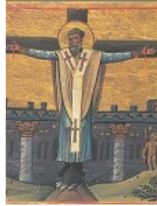
Άγιος Συμεών ο Αδελφόθεος Επίσκοπος Ιεροσολύμων