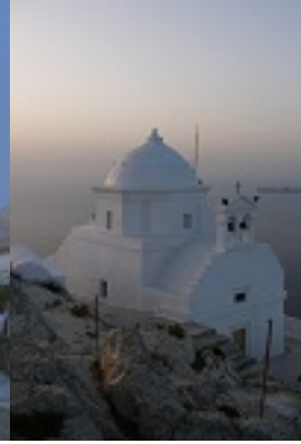
Το καθολικό της Παλαιάς Μονής Καλαμιώτισσης Ανάφης