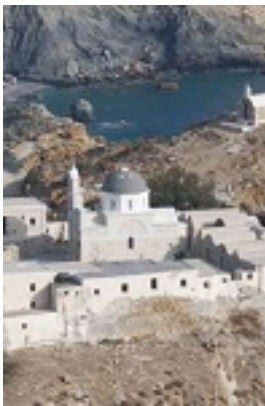
Η νέα Μονή Καλαμιώτισσης Ανάφης