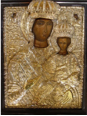
Παναγία η Καλαμιώτισσα