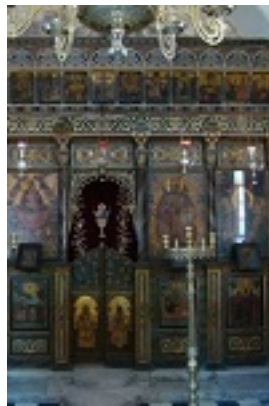
Το τέμπλο του Καθολικού της νέας μονής Καλαμιώτισσης