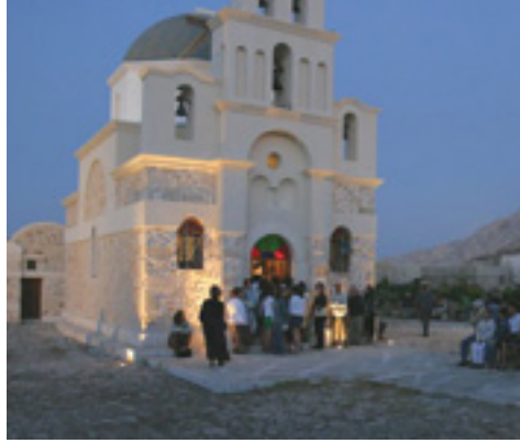
Παναγία η Καλαμιώτισσα