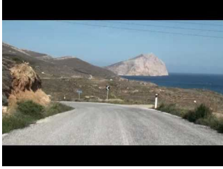
Ιερά Μονή Παναγίας Καλαμώτισσας Ανάφης