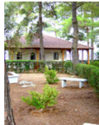
Παναγία η Φανερωμένη<br />στην Λευκάδα