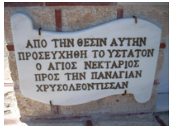
Προσκύνημα Αγίου Νεκταρίου