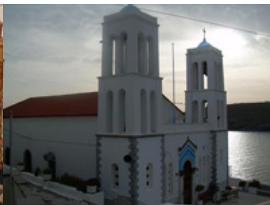
Παναγία η Θεοσκέπαστη στην Άνδρο