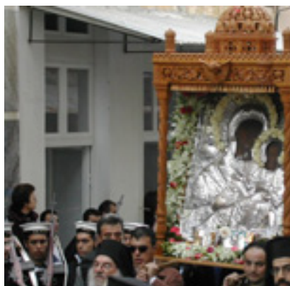
Παναγία η Θεοσκέπαστη στην Άνδρο