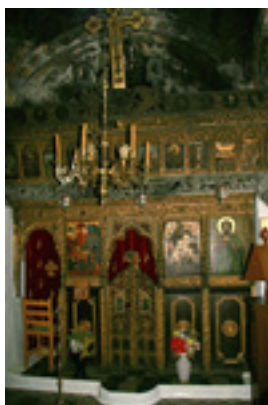
Παναγία η Κουνίστρα