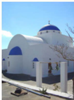
Παναγία η Μαλτέζα