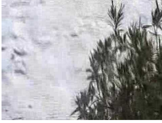
Παναγία η<br />Χοζοβιώτισσα