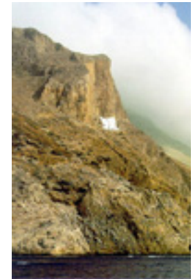
Παναγία η Χοζοβιώτισσα