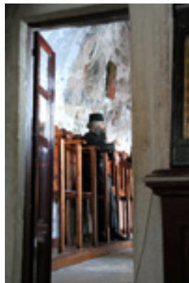
Παναγία η Χοζοβιώτισσα