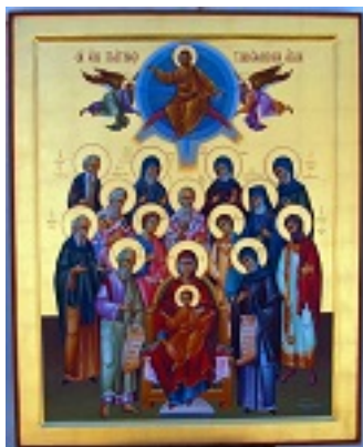
Σύναξις των εν Πάτμω Αγίων