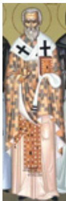
Άγιος Βασιλέας Ιερομάρτυρας Επίσκοπος Αμασείας