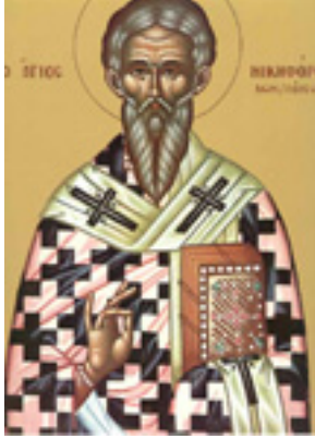
Άγιος Νικηφόρος ο Ομολογητής, Πατριάρχης Κωνσταντινουπόλεως