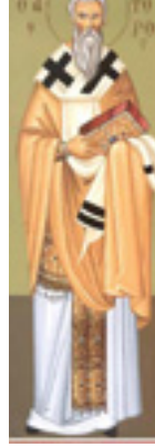
Άγιος Νικηφόρος ο Ομολογητής, Πατριάρχης Κωνσταντινουπόλεως