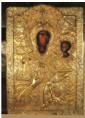
Παναγία η Αγία Σιών