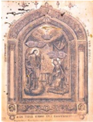
Πιστό αντίγραφο της εικόνας της Παναγίας της Μεγαλόχαρης, «Έργο Φραγκίσκου Δεσύπρη Τηνίου 1858»