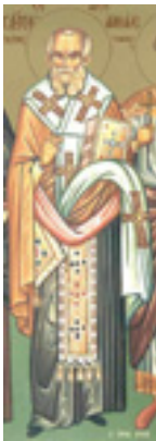
Άγιος Κλήμης Επίσκοπος Αγκύρας